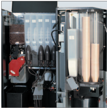
City M espresso