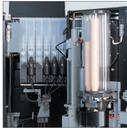
City M instant