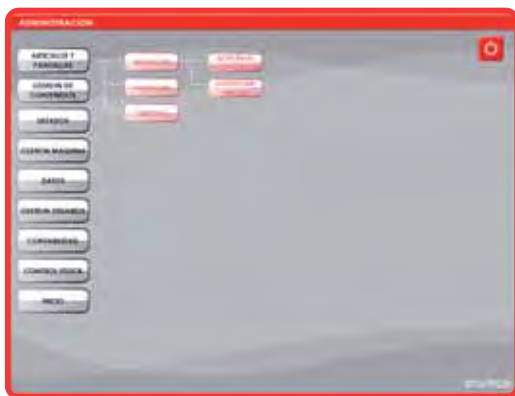
Ejemplo Programa de Administración.