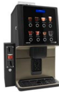
Kit módulo validador Preparado para instalar un validador de monedas.