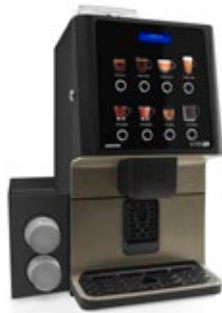
Kit módulo de vasos Para dispensar vasos.