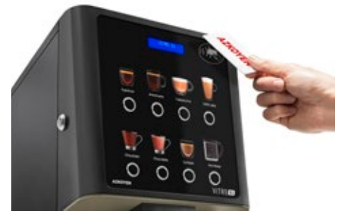
Kit Lector RFID Para tarjeta de recarga producto o sistemas cashless.