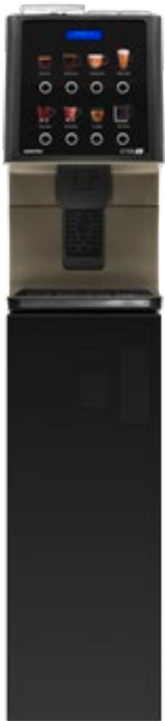
Kit peana Preparada para para validador de monedas. (850 mm.)

Para servicio de café en tiendas de conveniencia también es la solución perfecta y para los hoteles, donde el desayuno debe ser bueno, pero igualmente rápido, ofrece una experiencia agradable, con un diseño atractivo, sencillo y funcional.